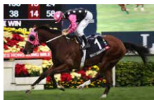
浪琴表香港一哩錦標