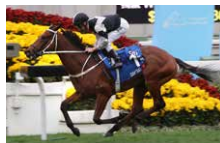
花旗銀行香港金盃