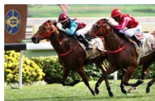
百週年紀念短途盃