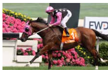
富衛保險冠軍一哩賽