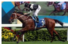
渣打冠軍暨遮打盃