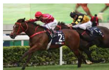
浪琴表香港短途錦標