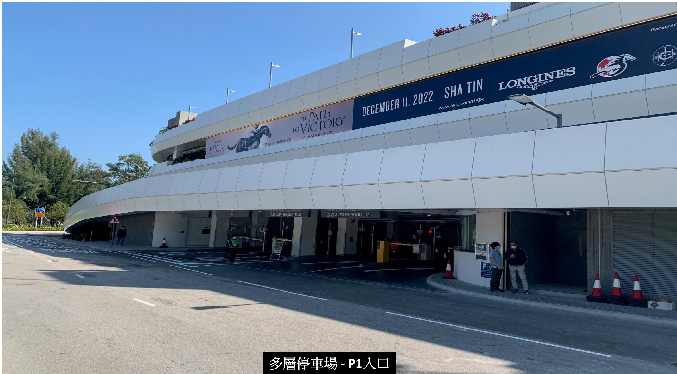
多層停車場 - P1入口